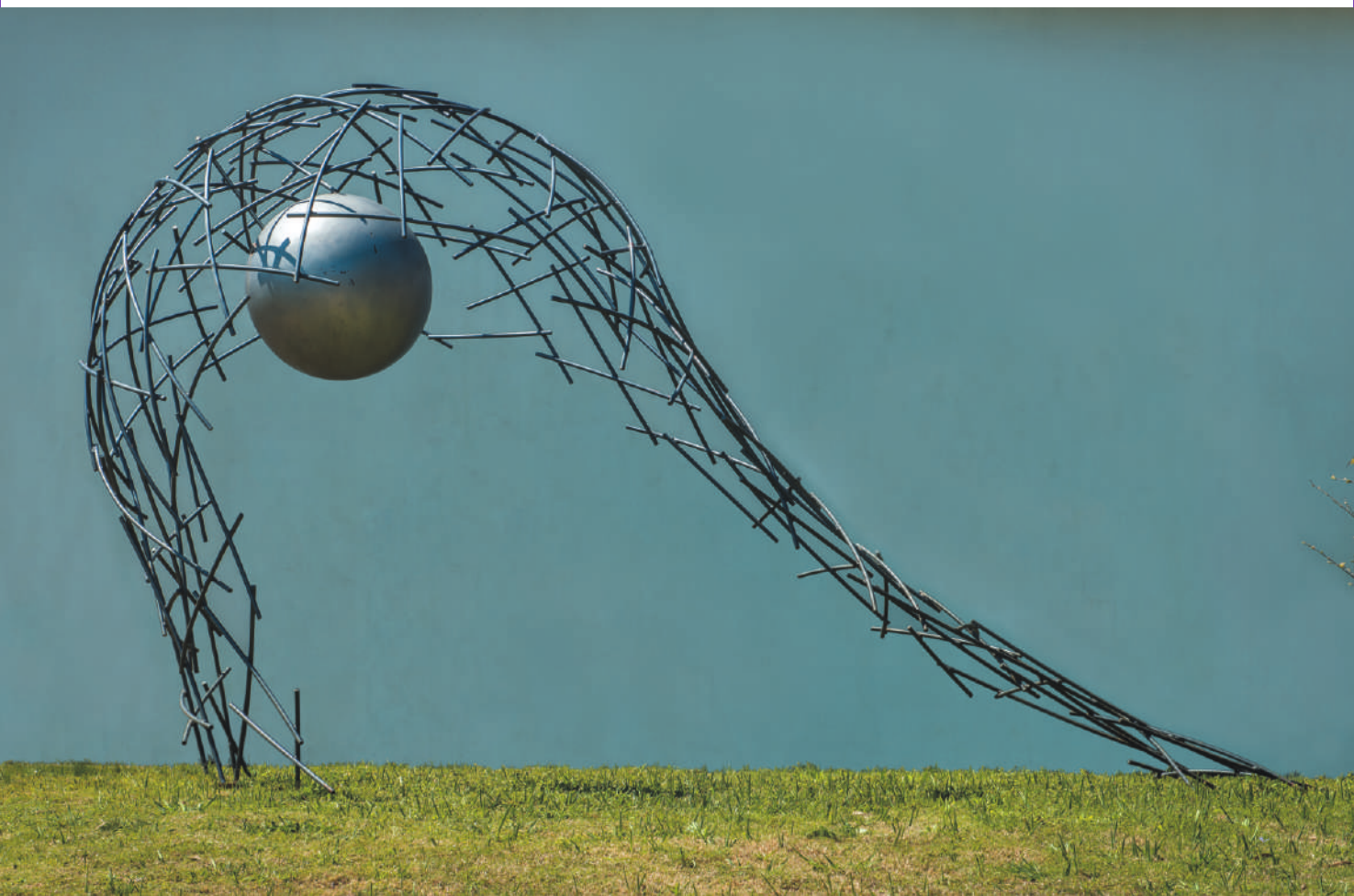
FPADS acero / steel, 5.1 x 3.4 x 2.3 m, Fundación y Museo Pablo Atchugarry, Manantiales, Uruguay, 2008