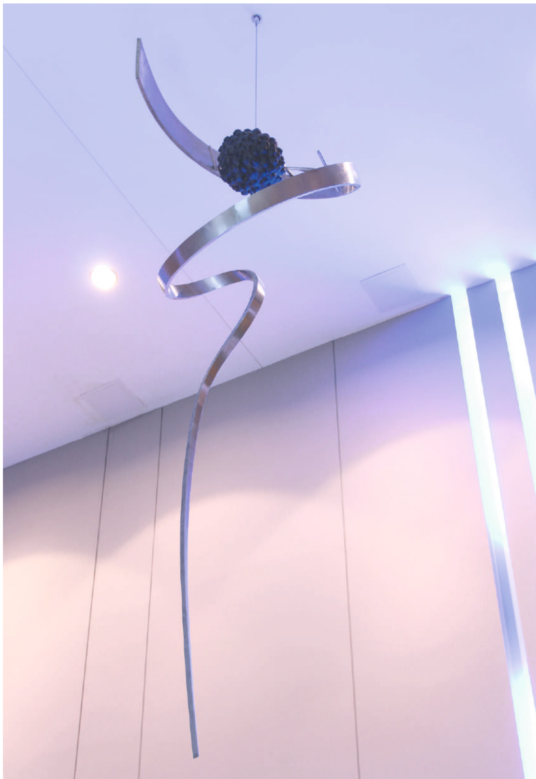
MWTS5, acero inox / stainless steel, 5.00 x 1.44 x 1.20 m. World Trade Center, Montevideo, Uruguay, 2010