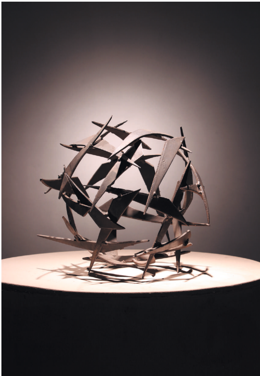
Zafíu, acero / steel, 26 x 24 x 23 cm, 2004