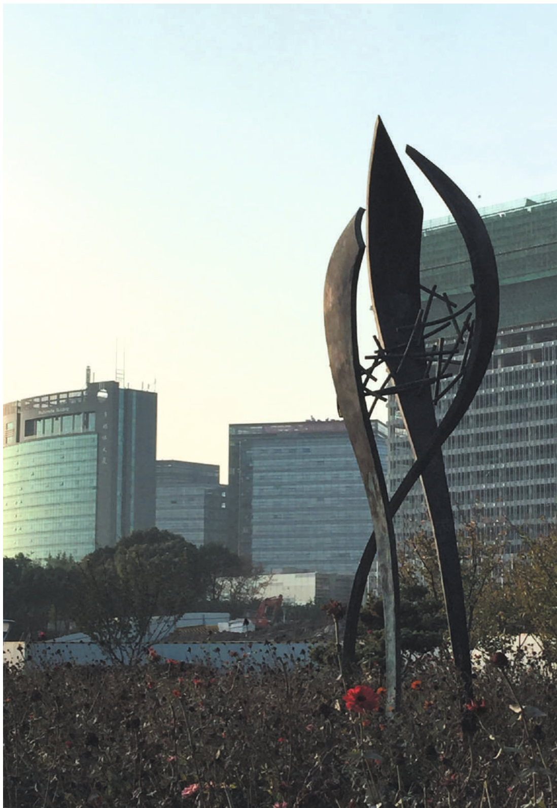
Contención, bronce / bronze, 7.00 x 2.40 x 2.50 m. Daning Lingshi Park, Shanghai, China, 2015