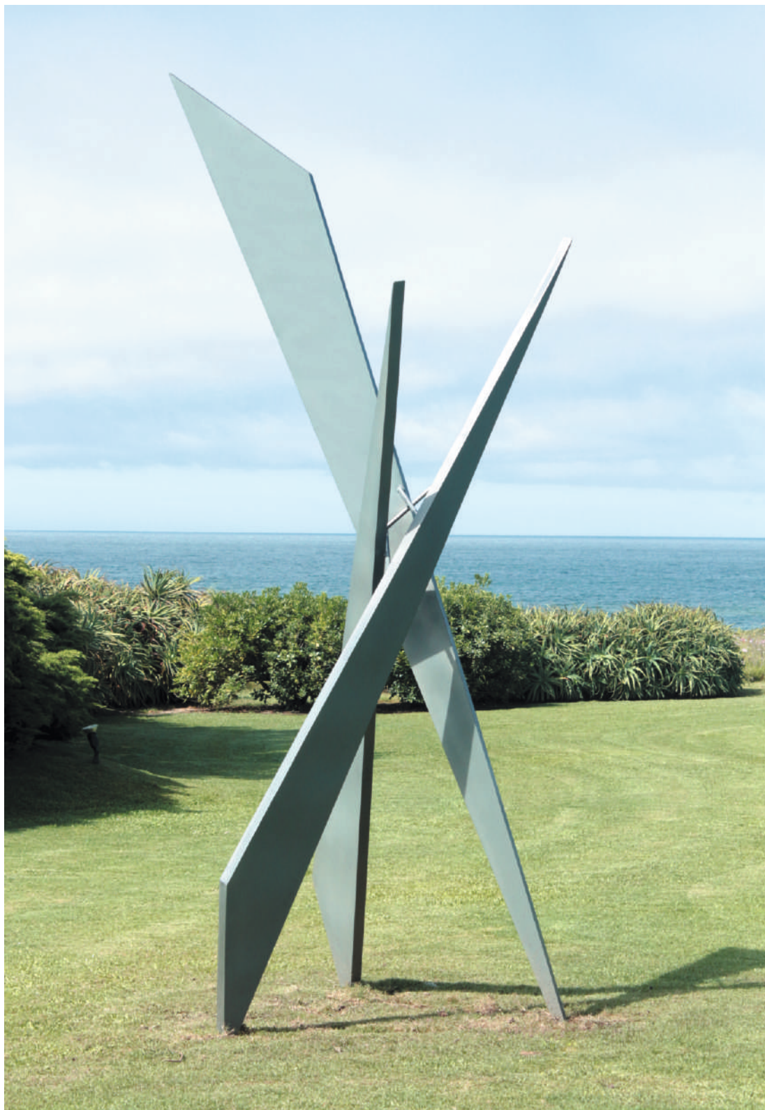
Intersección, acero inox pintado / painted stainless steel, 4.5 x 1.8 x 1.6 m, 2016