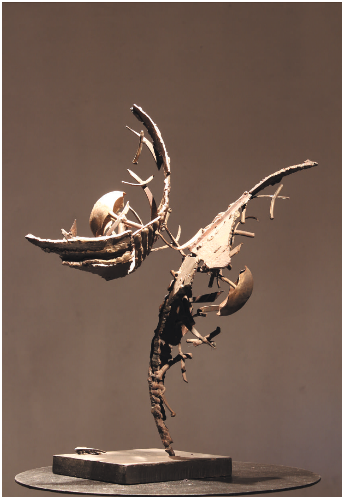
Mitosis, acero / steel, 43 x 37 x 22 cm, 2001