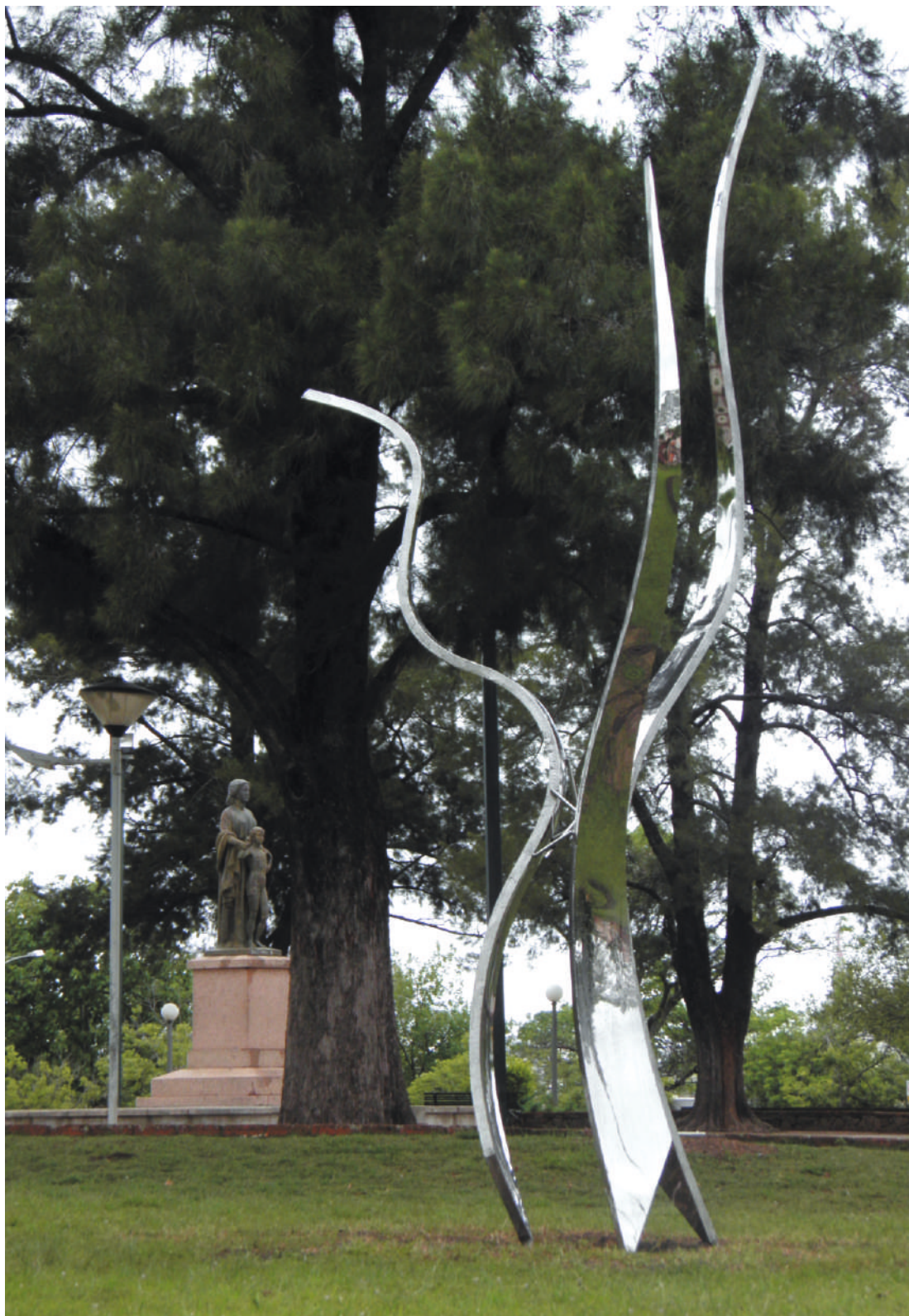
Árbol, acero inox pulido / brushed stainless steel, 5.00 x 2.25 x 1.90 m. Plaza Flores, Salto, Uruguay, 2012