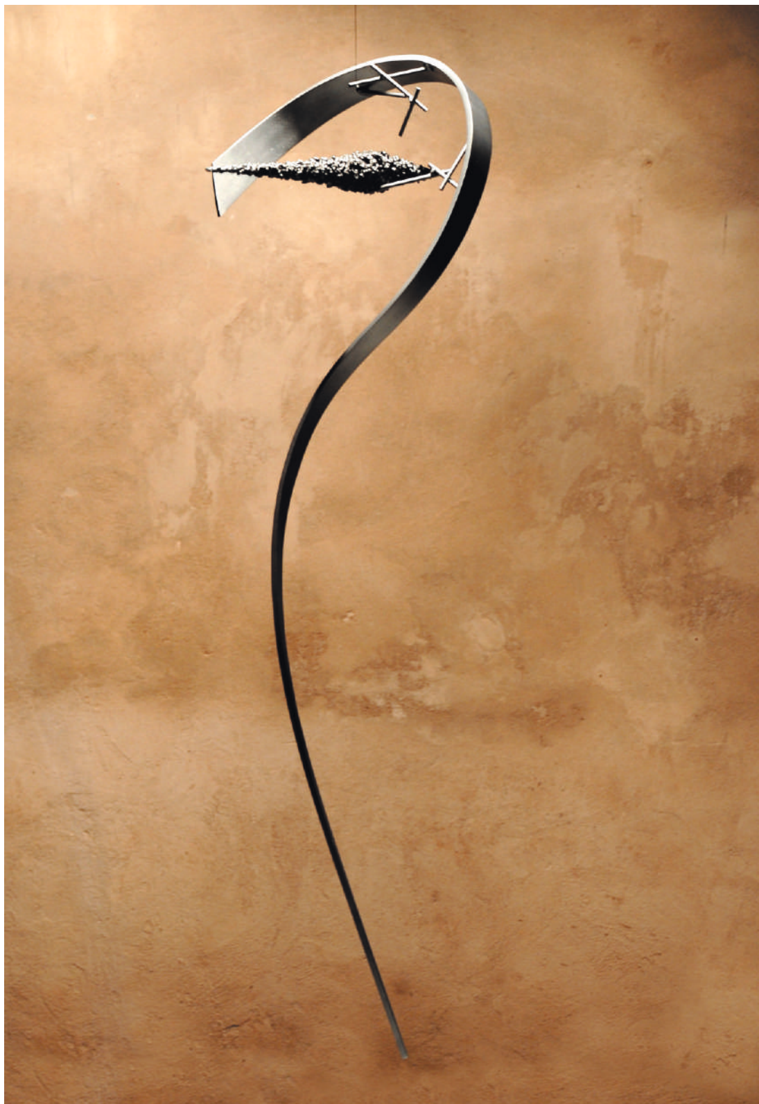
FMVGD I , acero / steel, 146 x 53 x 41 cm, Fundación Villacero, DF, México, 2007