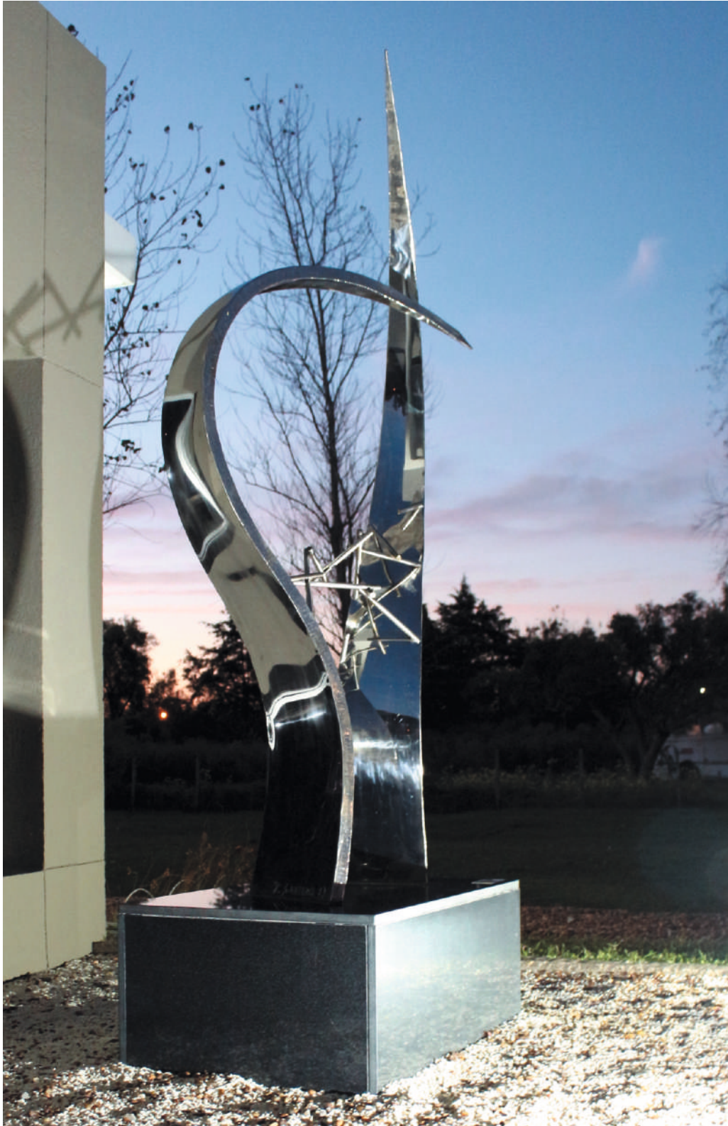
Indalo, acero inox pulido / brushed stainless steel, Dayman, Salto, Uruguay, 2013