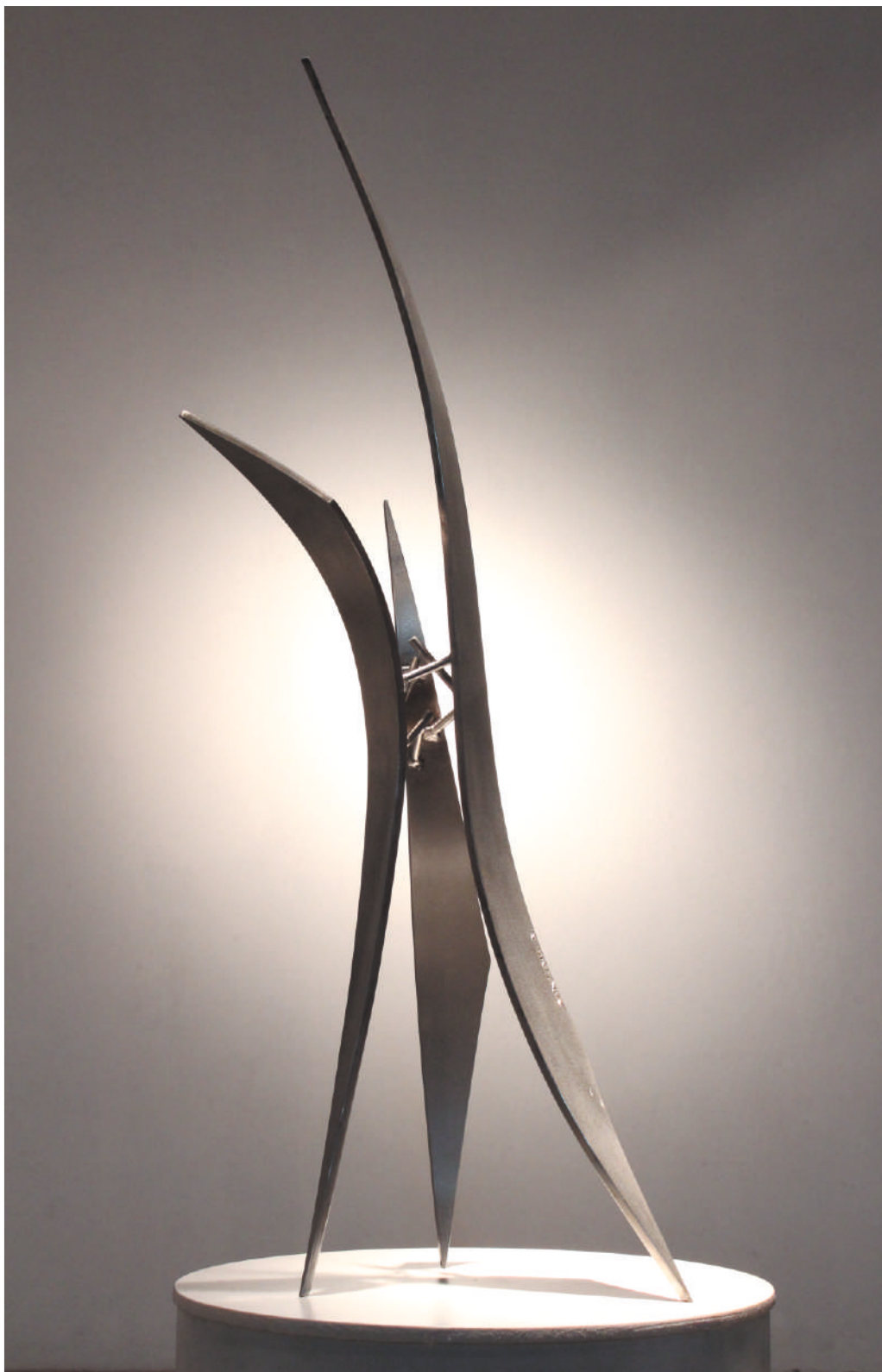
Reaching U, acero inox / stainless steel, 60 x 28 x 25 cm, Subasta New York Palace, 2013