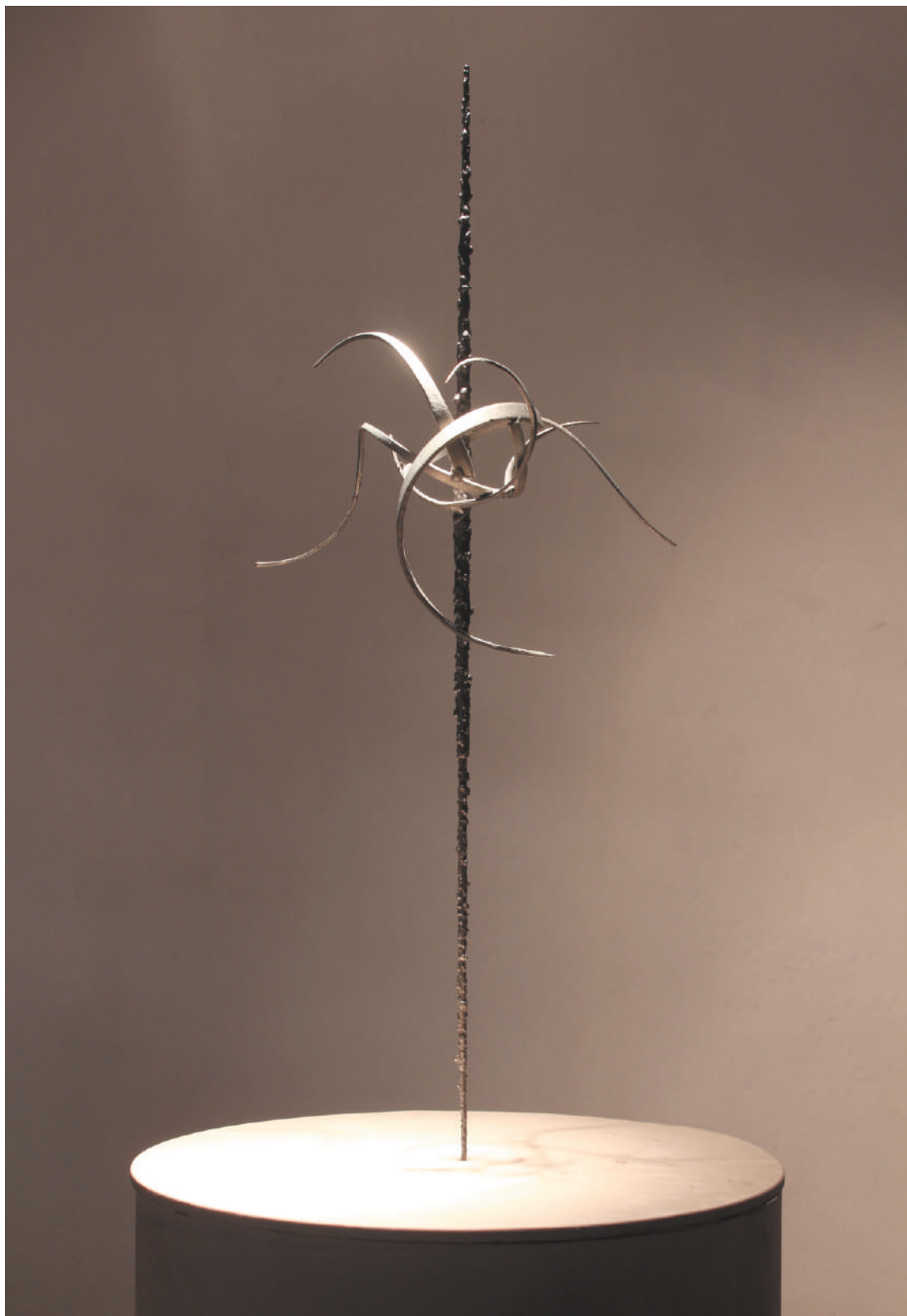
GRFL, acero / steel, 61 x 22 x 15 cm, 2005