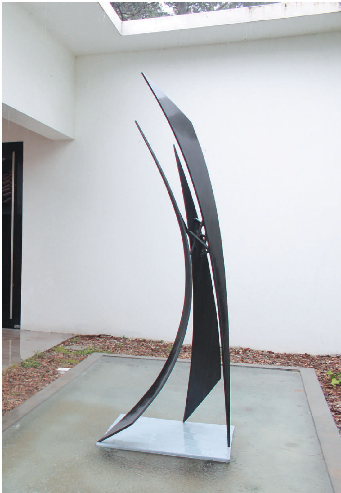
Destructura, acero / steel, 2.40 x 1.40 x 1.30 m. Centro Cultural Kavlin, Punta del Este, Uruguay, 2014