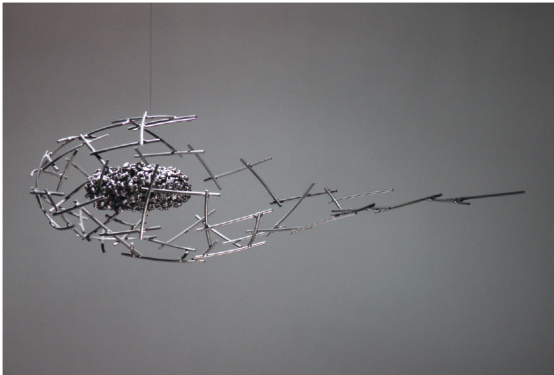
PDS03, acero - steel, 90 x 32 x 32 cm, 2009