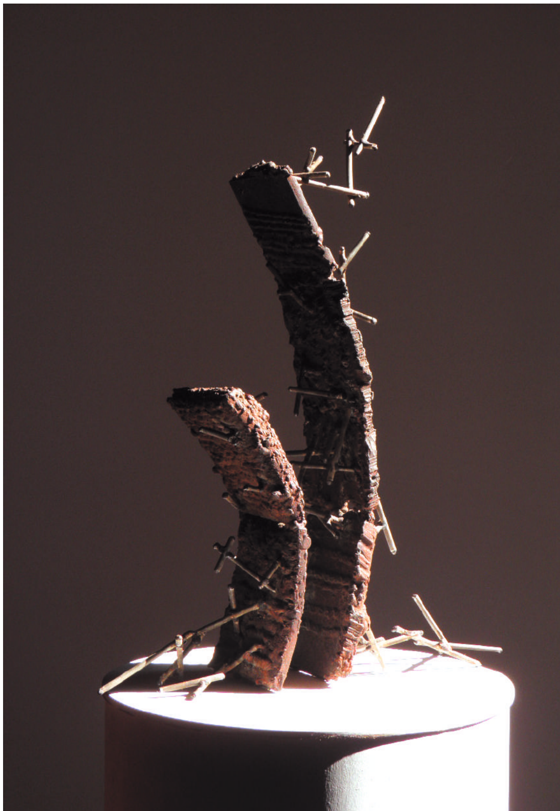
ÓxTII05, acero / steel, 58 x 45 x 13 cm, 2003