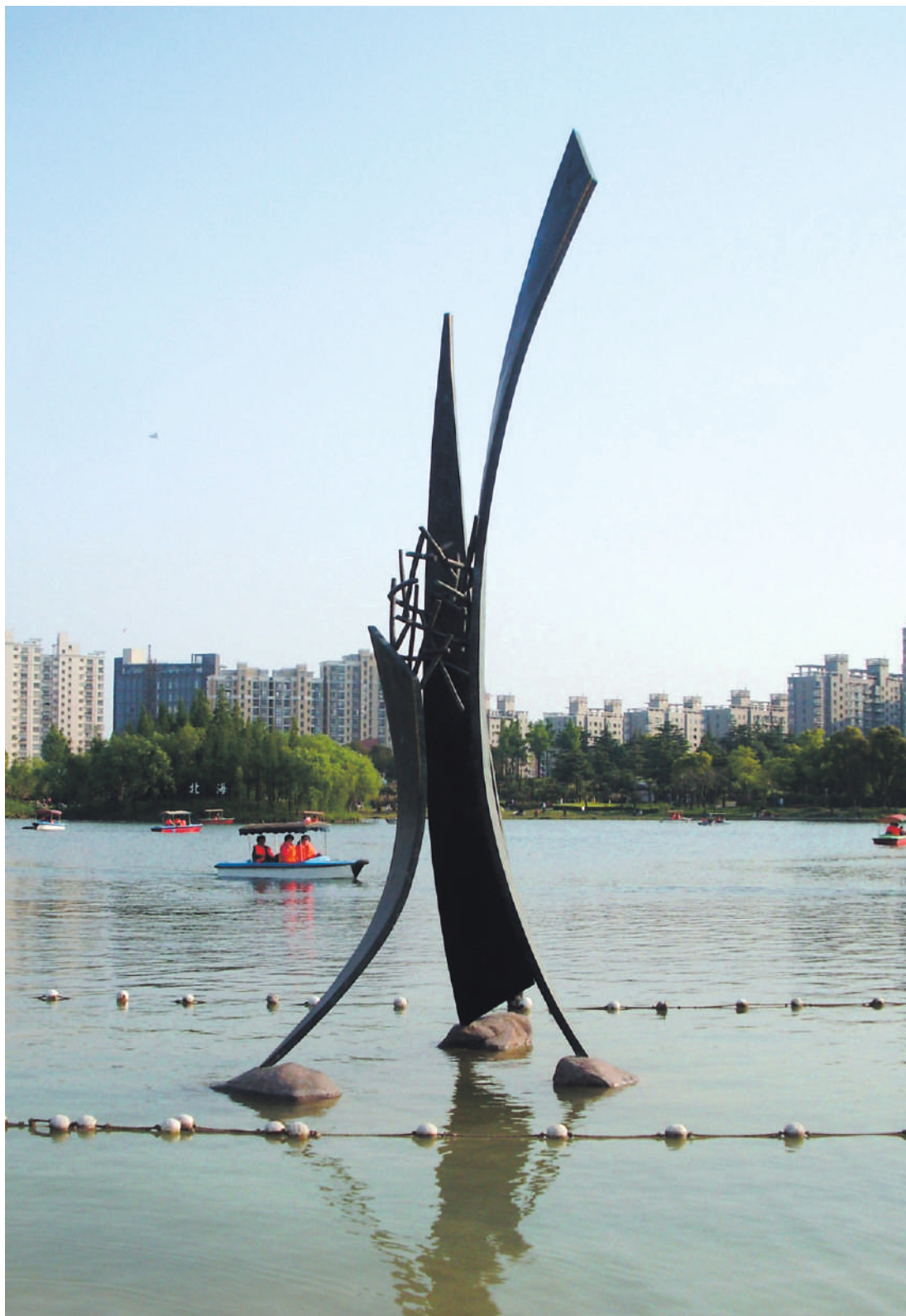
Ascenso, bronze / bronze, 6.1 x 2.3 x 2.1 m. Daning Lingshi Park, Shanghai, China, 2009