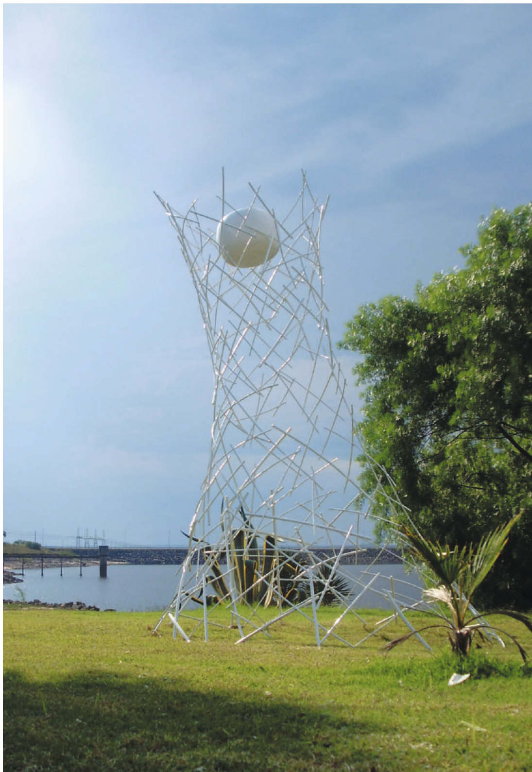
LBLIn, acero / steel, 3.4 x 1.8 x 1.6 m, Palmar, Soriano, Uruguay, 2007