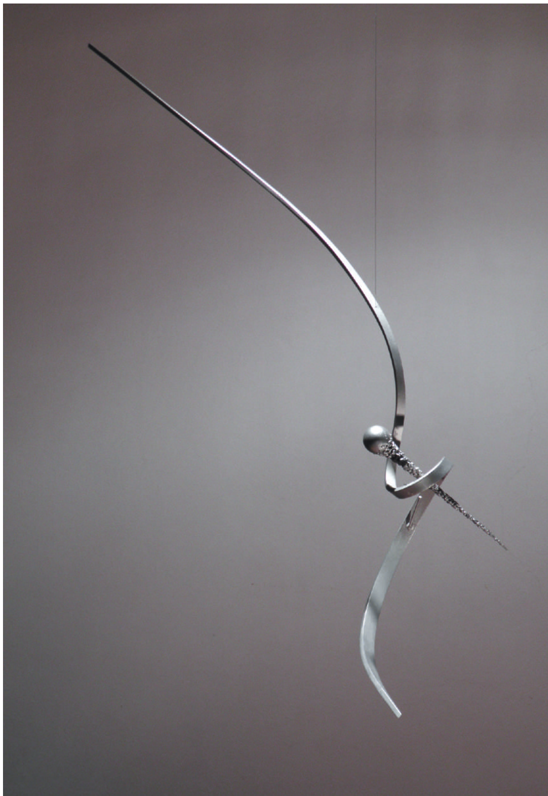
PDS09, acero / steel, 130 x 40 x 15 cm. LAKMA Museum, Amersfoort, Holanda, 2010