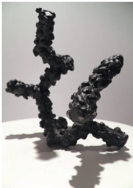
Objeto RDS04, rodamientos / steel bars 20 x 22 x 17 cm, 2013