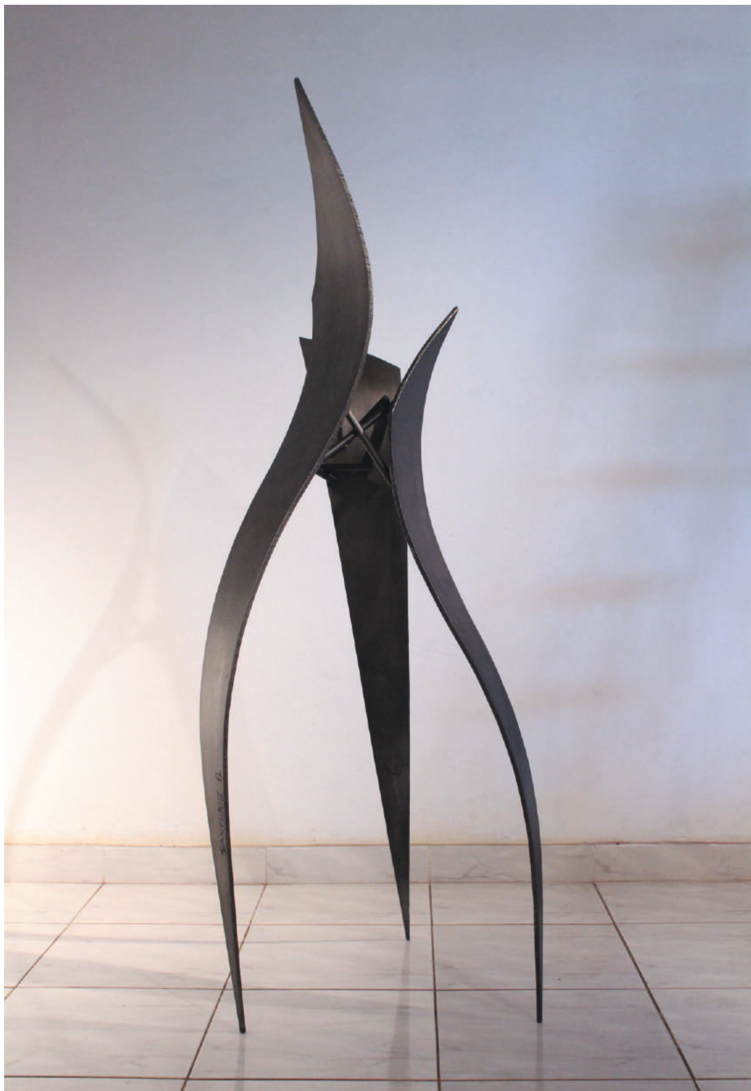
CromoY, acero / steel, 180 x 65 x 60 cm. 2014