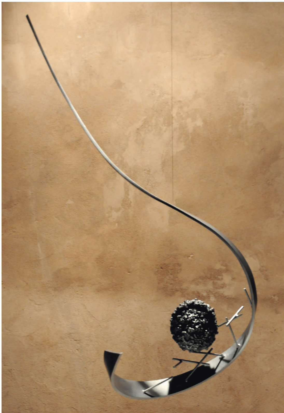
FMVGD II , acero / steel, 137 x 58 x 35 cm, Fundación Villacero, DF, México, 2007