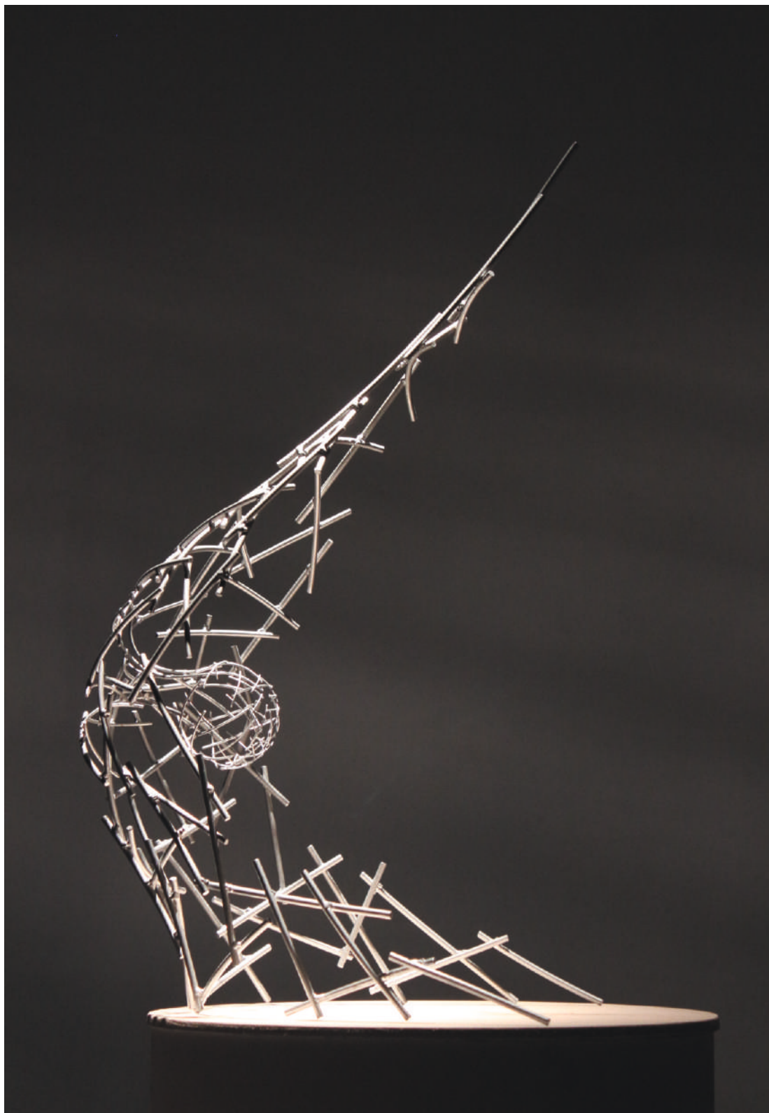
Proyecto Hidrofílica, acero inox / stainless steel, Universidad de la Republica, Salto, Uruguay