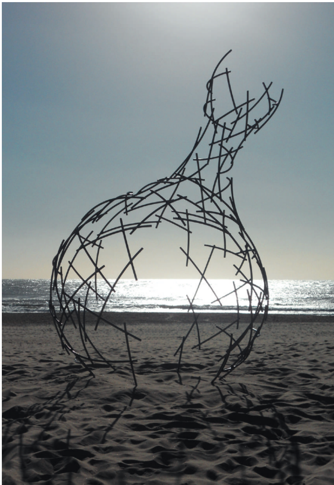
PRPL, acero / steel, 3.50 x 2.20 x 2.05 m, 2012