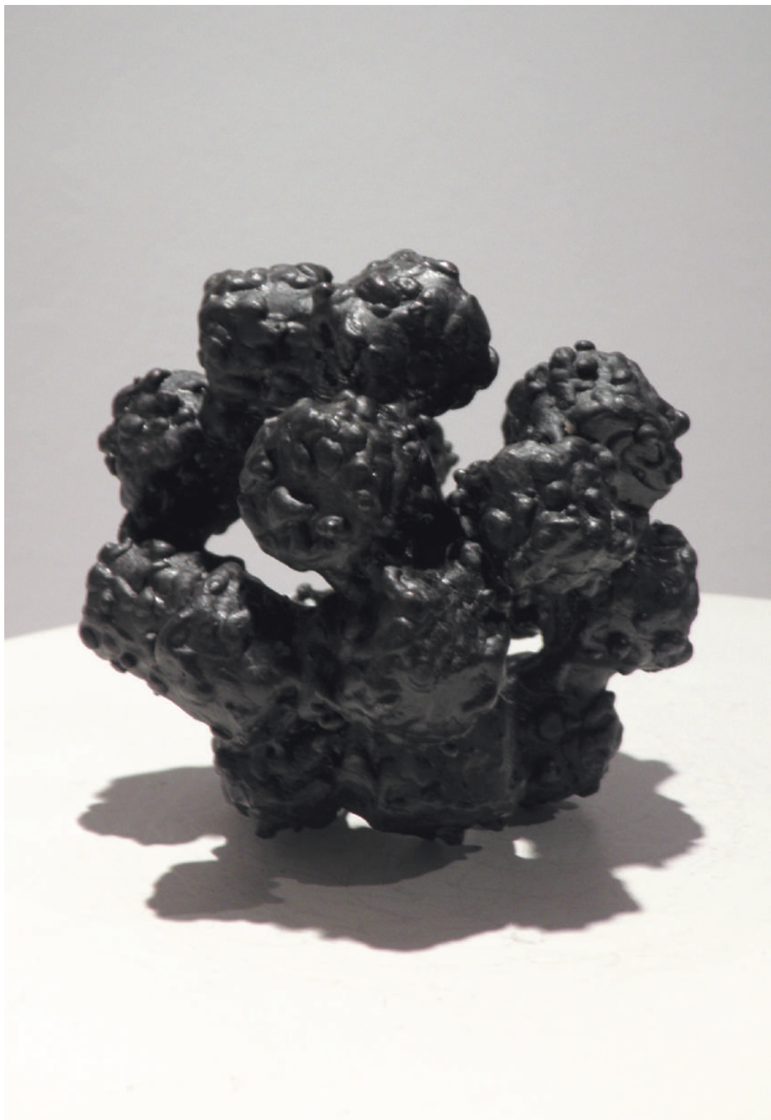
Objeto RDS03, rodamientos / steel bars, 11 x 11 x 11 cm, 2013