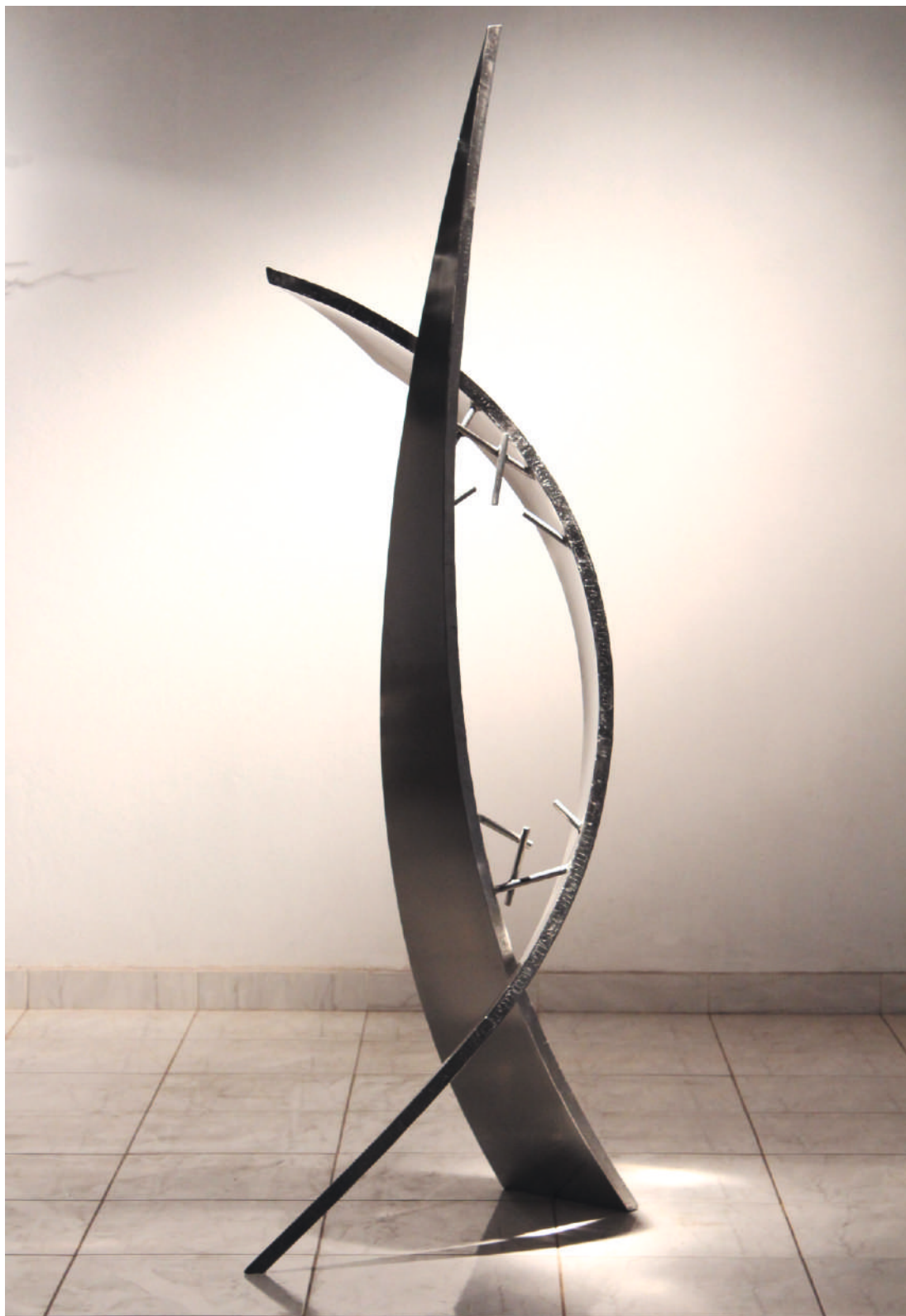
DNA-N, acero inox / stainless steel 233 x 90 x 50 cm, 2013