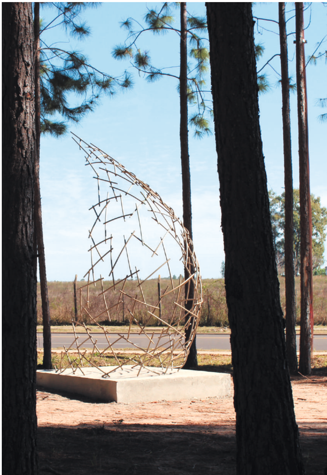
Introneuro, acero / steel, 3.2 x 1.8 x 2.1 m, Parque Antoine de Saint Exupéry, Entre Ríos, Argentina, 2014