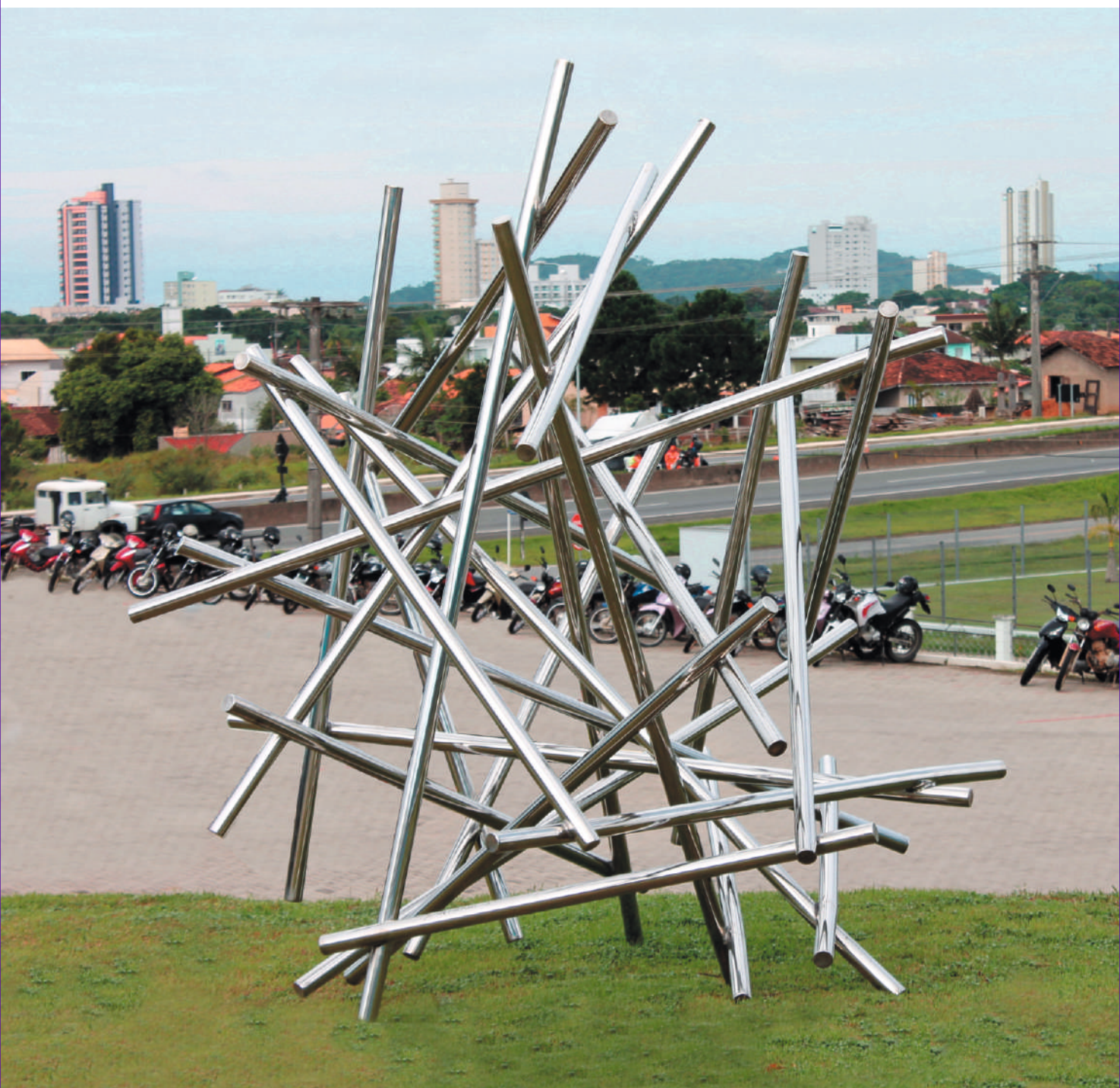
Continuo, acero inox / stainless steel, 2.60 x 2.60 x 2.50 m. Instituto ARXO, Santa Catarina, Brasil, 2014