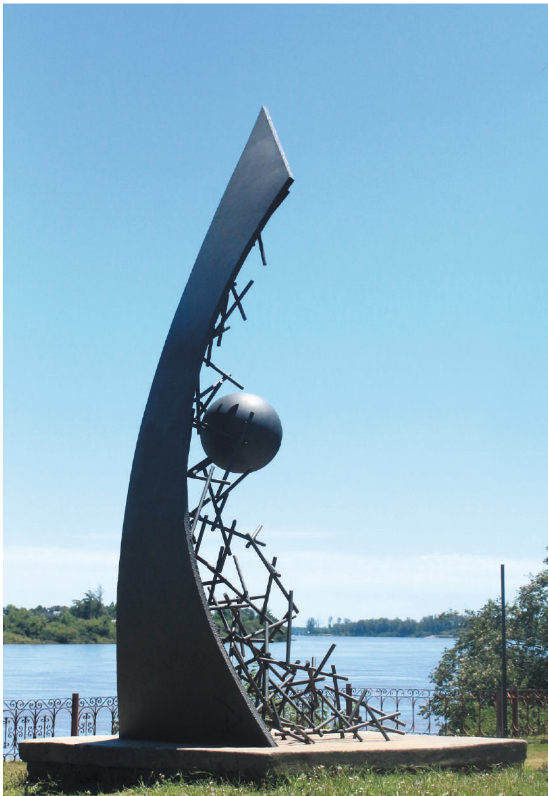
100 años CCEI Salto, acero / steel, 3.3 x 1.8 x 1.2 m, Parque Mattos Netto, Salto, Uruguay, 2005