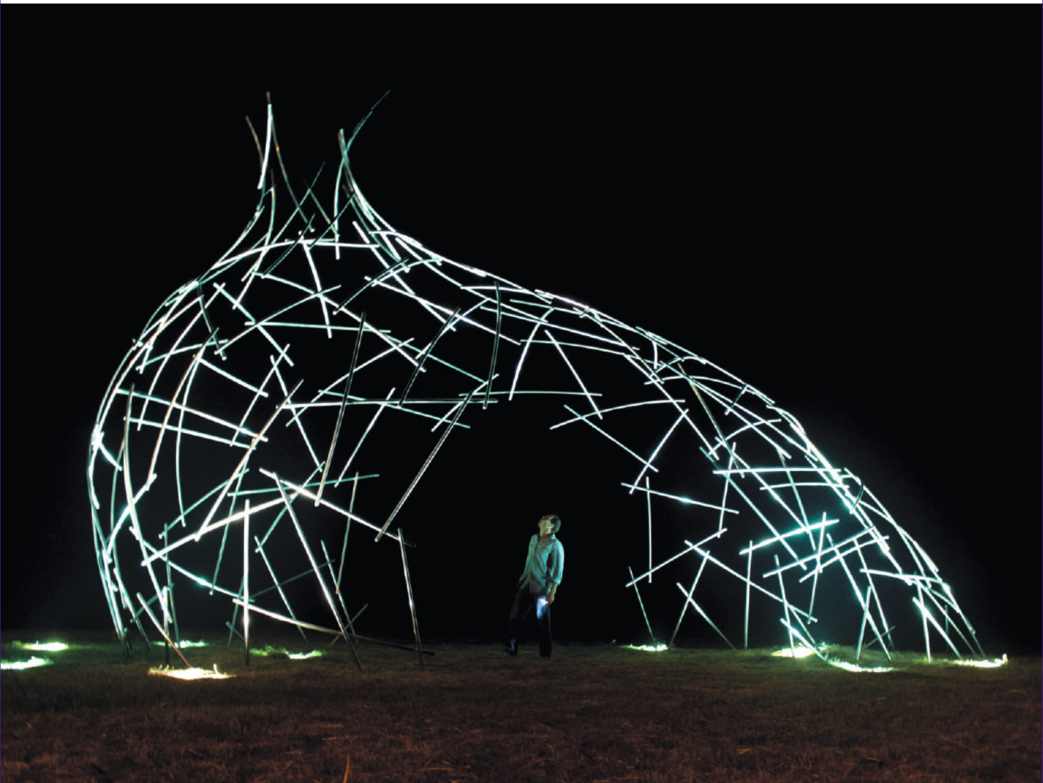
Conexa, acero inox / stainless steel, 11.20 x 7.20 x 4.50 m. Tierra Garzon, Maldonado, Uruguay, 2015