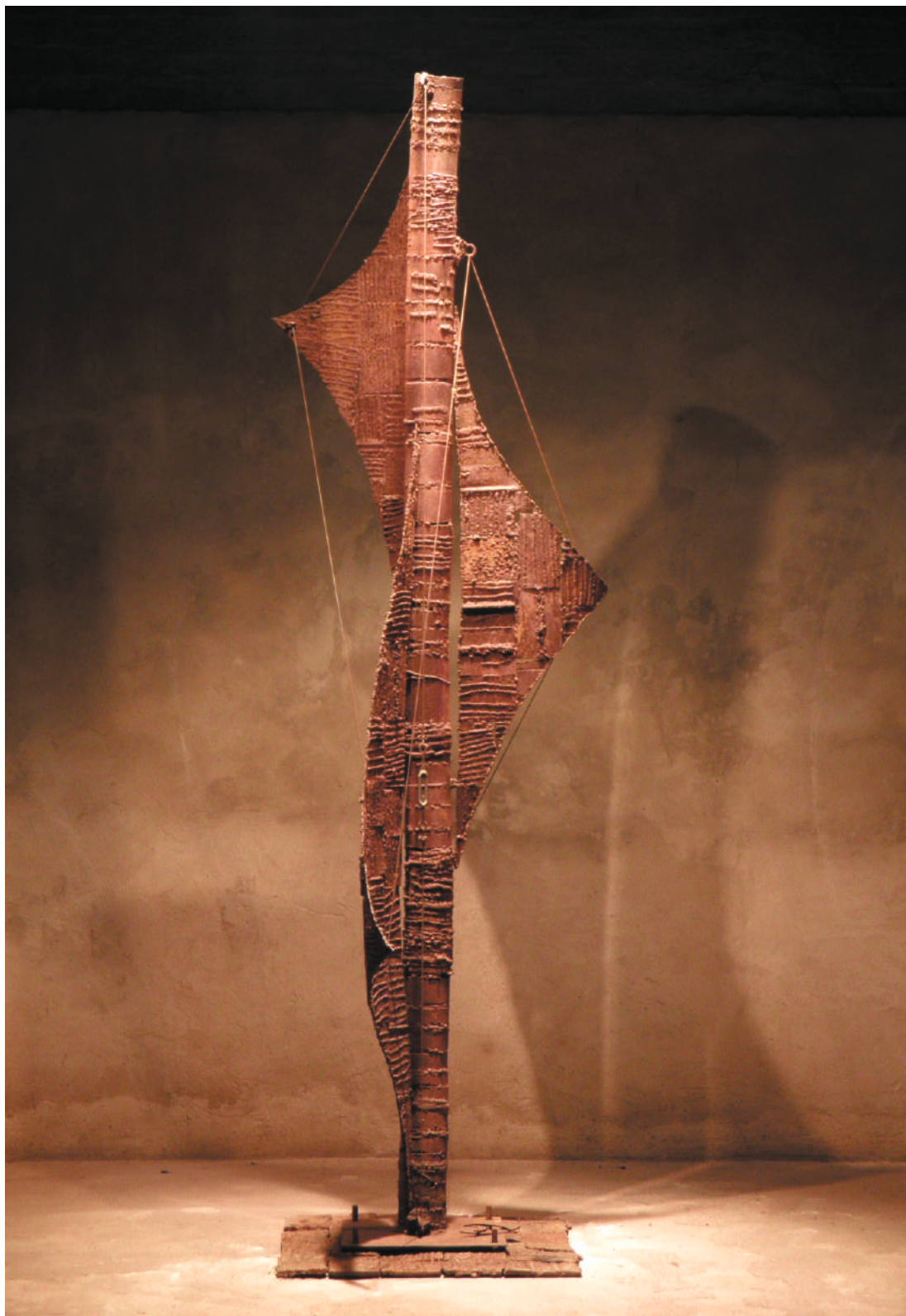
Mástil, acero / steel, 2.8 x 1.1 x 1.0 m, 2001