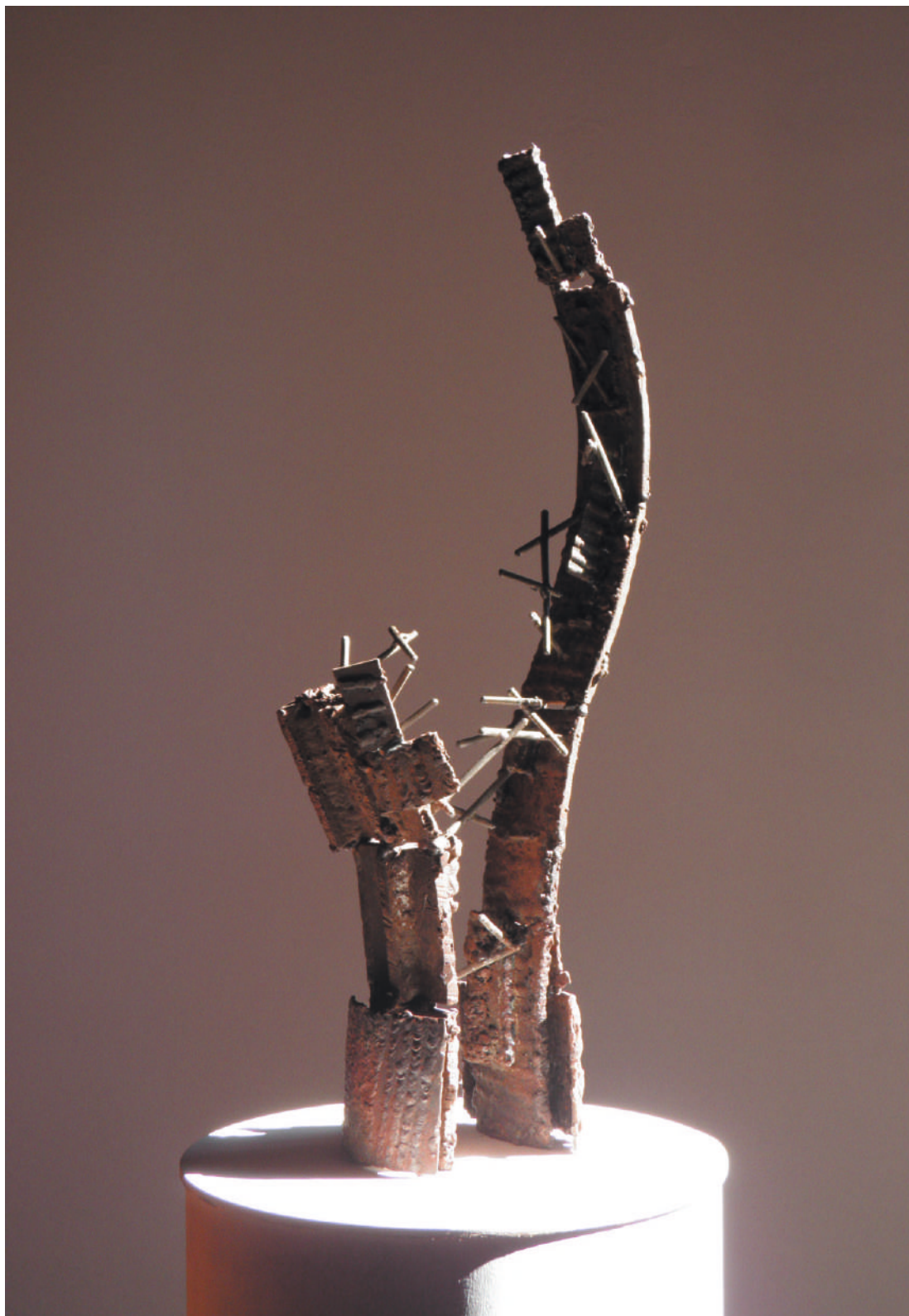
ÒxTII02, acero / steel, 69 x 25 x 14 cm, 2003