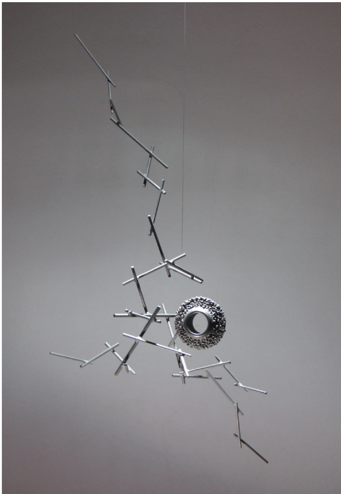
PDS09, acero / steel, 145 x 66 x 48cm, 2010