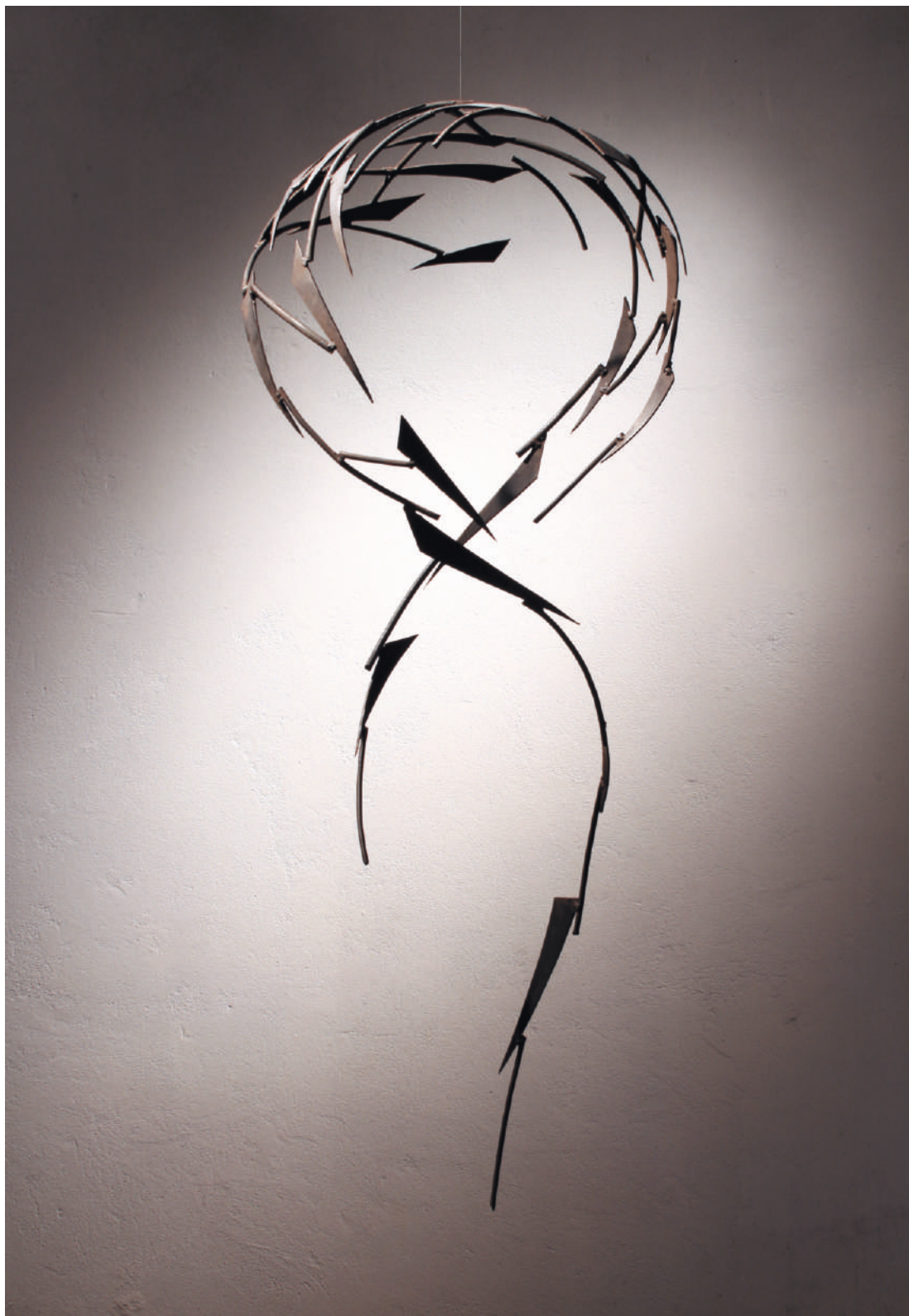
Idea, acero / steel, 114 x 55 x 45 cm, 2004