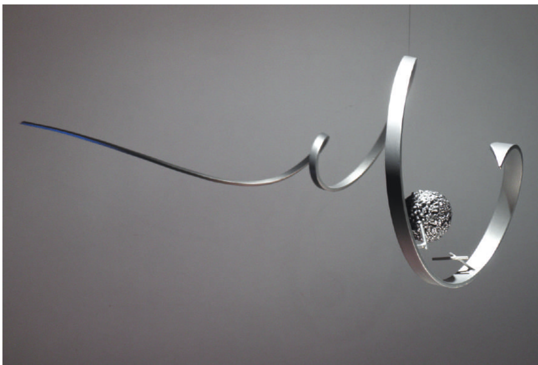
PDS05, acero / steel, 105 x 45 x 42 cm, 2010