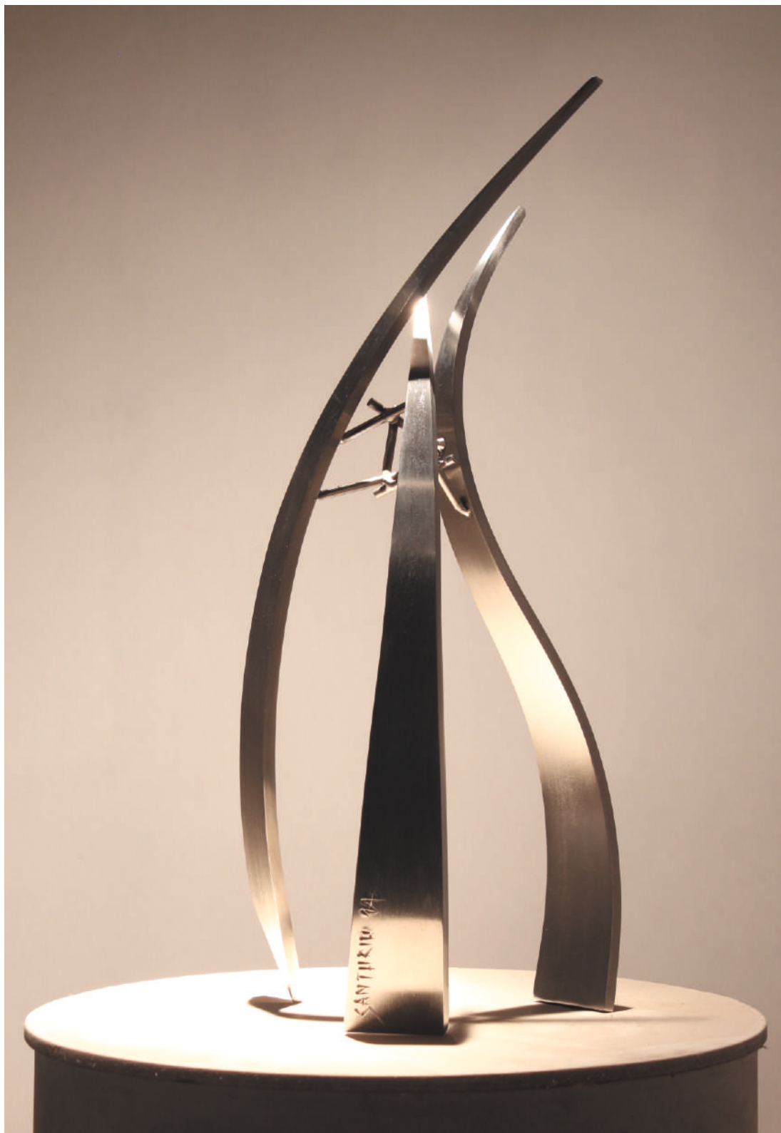
FLUD acero / inox stainless steel, 20 x 23 x 45 cm, 2014