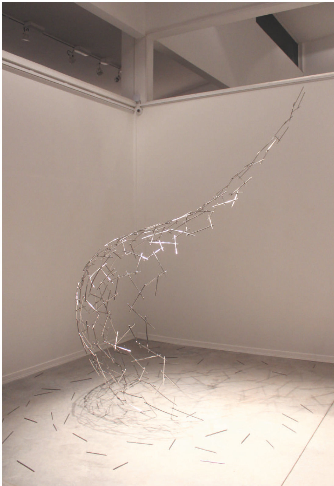
Matriz, acero inox / stainless steel, 3.00 x 2.70 x 2.70 m, 2014