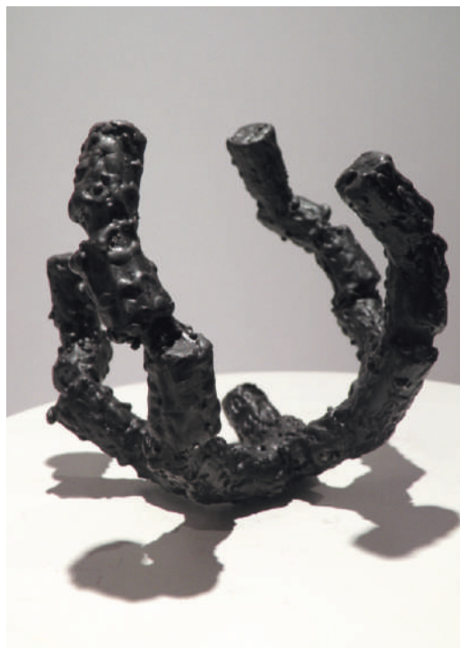
Objeto RDS11, rodamientos / steel bars 20 x 20 x 18 cm, 2013