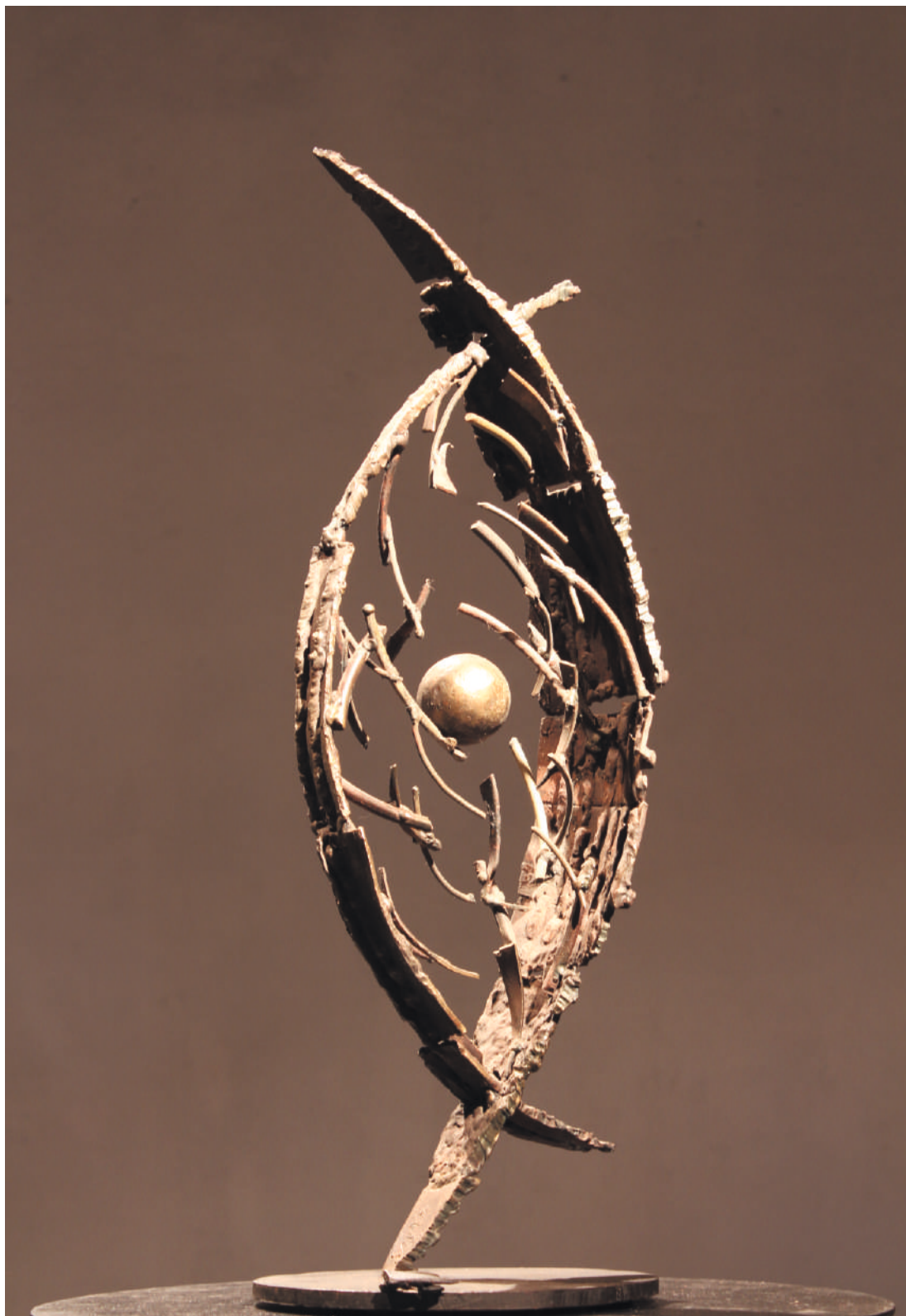
Celula, acero / steel, 49 x 17 x 16 cm, 2002